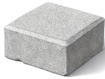
Paving Block - Cobble Stone (S) 105 x 105 mm