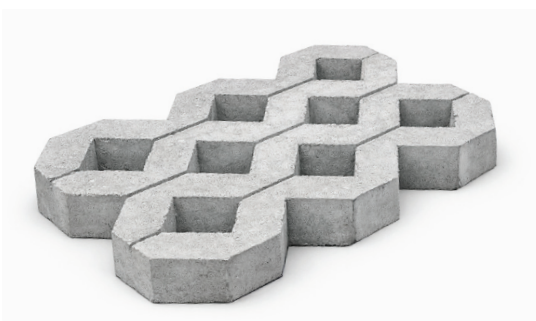
Grass Block 540 x 360 x 80 mm

Paving block adalah material konstruksi dari campuran semen dan pasir yang dipress menjadi berbagai bentuk untuk mengeraskan permukaan tanah. Berbeda dengan aspal, sistem pasangannya memiliki celah yang memungkinkan air hujan meresap ke dalam tanah (drainase alami), sekaligus menawarkan kemudahan perawatan karena blok dapat dibongkar-pasang secara parsial jika terjadi kerusakan.