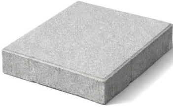
Paving Block - Cobble Stone (B) 210 x 210 mm