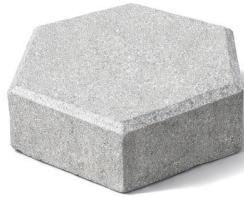
Paving Block - Segi 6 (Hexagonal)