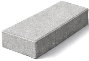
Paving Block - Holland 210 x 105 mm